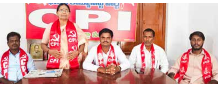
- రమేష్ కలెక్టరేట్ ముట్టడిని విజయవంతం చేయండి... వనపర్తి టౌన్ సీటీ టైమ్స్ జూన్ 9