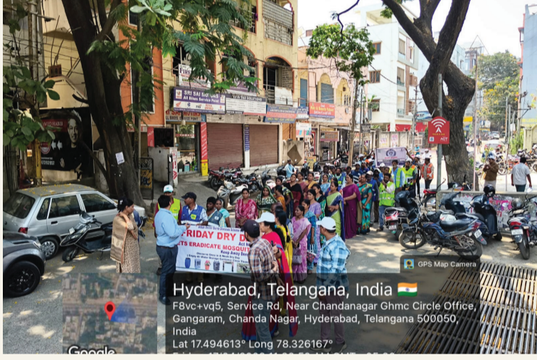
అవసరమైన చోట యాంటీ-లారా మందులతో చర్యలు చేపట్టడం జరుగుతున్నట్లు తెలిపారు. అన్ని

దోచుల వృద్ధిని అరికట్టి వ్యాధుల వ్యాప్తిని నివారించేందుకు సైబరాబాద్ సమస్యల కార్యకర్తల 'అర్బన్ మలేరియా స్కీమ్' కింద శుక్రవారం అన్ని జోన్లలో ముమ్మరంగా యాంటీ-లారా అవగాహన, ఎంటమాలజీ చర్యలను చేపట్టినట్లు కమిషనర్ శ్రీజన తెలిపారు. మొత్తం 107 కాలనీలలో తనిఖీలు నిర్వహించి 287 దోచుల ఉత్పత్తి కేంద్రాలను గుర్తించగా, 109 కేంద్రాల్లో నివారణ చర్యలు చేపట్టినట్లు పేర్కొన్నారు. దోచుల ఉత్పత్తి కేంద్రాలను గుర్తించి నిర్మూలించేందుకు బహిరంగ ప్రదేశాల్లో, ప్రాంతాల్లో నిల్వ ఉన్న నీటిని తొలగించడం,