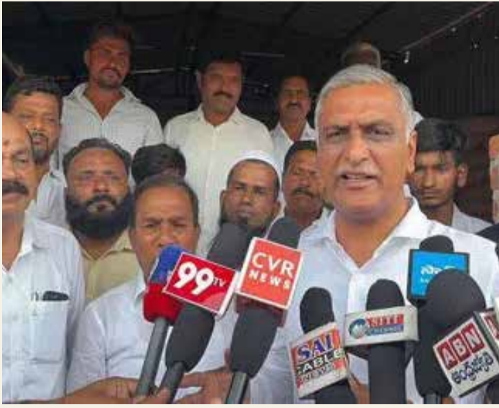
మీ ప్రభుత్వం రైతుల కోసమా?