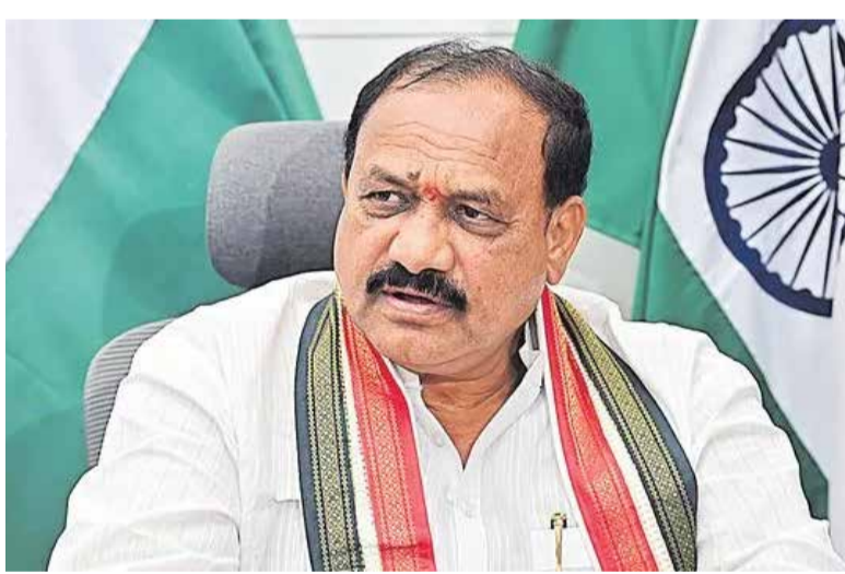
వచ్చే బీఆర్ఎస్ పాలనపై తీవ్ర విమర్శలు గుప్పించారు.

నిజామాబాద్ మీడియా సమావేశంలో టీపీసీసీ చీఫ్ మహేష్ కుమార్ గౌడ్ కీలక వ్యాఖ్యానం చేశారు. ప్రజా స్వామ్యంలో ఎవరు పార్టీ స్థాపించినా, పాదయాత్ర చేసినా తమకు ఎలాంటి అభ్యంతరం లేదన్నారు. సిరి సిల్ల ఎమ్మెల్యే, బీఆర్ఎస్ వర్కర్ గ్రెనాడియన్ కేటీఆర్ చేపట్టే పాదయాత్రను తాము సాగిస్తామని స్పష్టం చేశారు. ప్రజాస్వామ్య విలువలను గౌరవిస్తూ ప్రతి రాజకీయ కార్యక్రమాన్ని ఆదరిస్తామన్నారు. బీఆర్ఎస్ నిక భవిష్యత్తు లేదని, వచ్చే ఎన్నికల్లో కాంగ్రెస్ కు విజ్ఞప్తి చేసేటప్పుడు అది మహిళా కుమార్ పేర్కొన్నారు. బీఆర్ఎస్ పార్టీ పేరు మార్చినా, కొత్త పేర్లతో వచ్చినా వచ్చే ఎన్నికల్లో అధికారం మాత్రం కాంగ్రెస్ దే అని టీపీసీసీ చీఫ్ మహేష్ కుమార్ ధీమా వ్యక్తం చేశారు. బీఆర్ఎస్, బీజేపీలు కలిసి పోటీ చేసినా ప్రజలు తమ వెంటనే ఉంటారని విశ్వాసం వ్యక్తం చేశారు. వచ్చే ఎన్నికల్లో తమకు గట్టి పోటీదారులే లేరన్నారు. గత