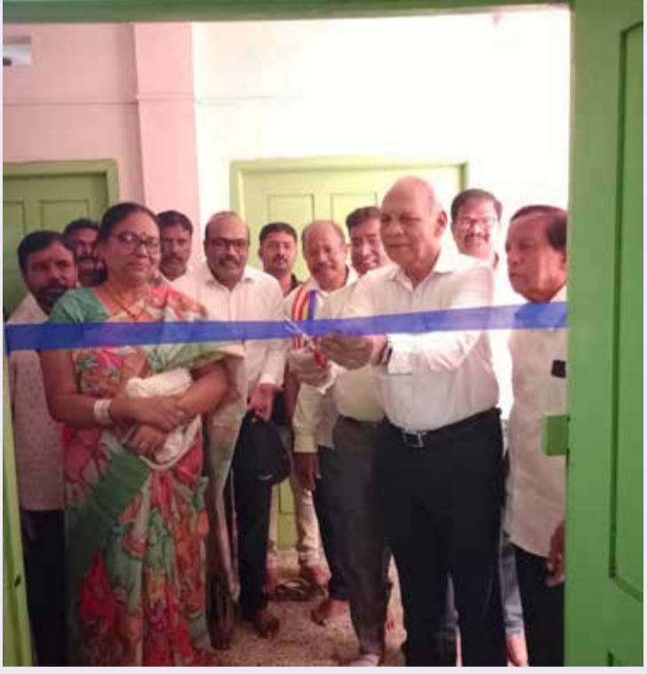
లోక్ కుంట, ఏప్రిల్ 13 (సిటీ టైమ్స్):