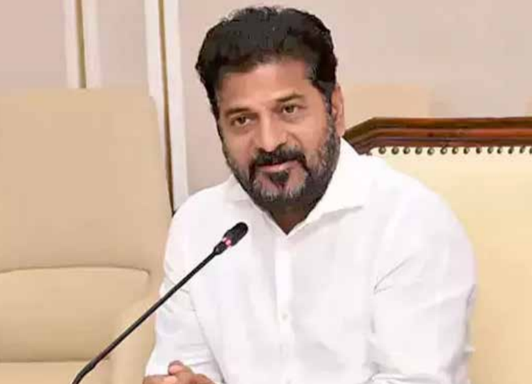
హైదరాబాద్, సీటీ టైమ్స్

మహిళా బిల్లుకు ప్రతి ఒక్కరూ మద్దతిస్తారని సీఎం రేవంత్ రెడ్డి అన్నారు. లోక్ సభ సీట్ల పెంపు విషయంలోనే భిన్నాభిప్రాయాలు ఉన్నాయని పేర్కొన్నారు. ఈ మేరకు ప్రధాని మోదీని ఉద్దేశించి సీఎం రేవంత్ రెడ్డి వివరాలపై అఖిలపక్ష భేటీలో చర్చించి నిర్ణయం తీసుకోవాలి. లోక్ సభ సీట్ల పెంపు, మహిళా రిజ