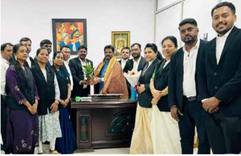
అభిప్రాయం.. - 2 ఎకరాల భూమి, ఖాళీ పోస్టుల భర్తి, కొత్త కోర్టు భవనం అంశాలు ప్రస్తావన.. కుషాయిగూడ, ఏప్రిల్ 13 (సీటీ టైమ్స్):