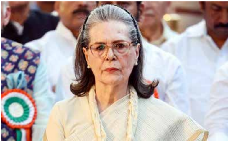
ఒకసారి కాదు ఇప్పటికే మూడు సార్లు కేంద్రానికి లేఖ రాసింది. అయినా అందరికీ ఉపయోగపడే ఈ అభ్యర్థనను ప్రధాని తిరస్కరించారు. దానికి బదులుగా ప్ర

మహిళా రిజర్వేషన్ల బిల్లు కంటే నియోజకవర్గాల పునర్విభజనే అత్యంత ముఖ్యమైన అంశమని కాంగ్రెస్ అగ్ర నాయకురాలు, ఆ పార్టీ పార్లమెంటరీ చైర్ పర్సన్ సోనియా గాంధీ అన్నారు. లోక్ సభలో సీట్ల పెంచేందుకు చేపట్టిన పునర్విభజన ప్రక్రియను రాజ్యాంగంపై చేస్తోన్న దాడిగా అభివర్ణించారు. అంతేగాక, ఎన్నికల సమయంలో 'నారీ శక్తి వందనం అధినియమ్' సవరణ బిల్లును తీసుకురావడంపైనా ఆమె అనుమానాలు వ్యక్తం చేశారు. "రిజర్వేషన్లు, డిలిమిటేషన్లపై కేంద్రం తీసుకొచ్చిన కొత్త ప్రతిపాదనలపై చర్చించేందుకు పశ్చిమ బెంగాల్ అసెంబ్లీ ఎన్నికలు ముగిశాక సమావేశం ఏర్పాటు చేయాలి. ఈ ప్రతిపాదన గురించి ప్రతిపక్షం