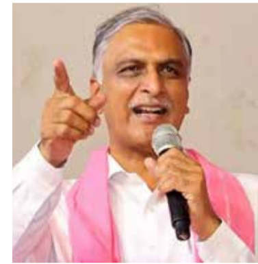
హైదరాబాద్, సిటీ టైమ్స్

తెలంగాణ ఉద్యమంలో రాజీనామా చేయక వెన్నుచూపి పారిపోయిన కేంద్ర మంత్రి కిషన్ రెడ్డి పార్లమెంట్ సాక్షిగా మరోసారి ద్రోహానికి పాల్పడ్డారని మాజీ మంత్రి, డిప్యూటీ స్పీకర్ లీడర్ హరీశ్ రావు మండిపడ్డారు. రాజ్యసభలో కిషన్ రెడ్డి పచ్చి అబద్ధాలతో, చరిత్ర వక్రీకరణలతో తన లోపలి వికృతత్వాన్ని బయట పెట్టుకున్నారని ఆరోపించారు. ఏడు మందలాలను ఏపీకి అప్పగించాలనేది విభజన చట్టంలో ఉందని కిషన్ రెడ్డి పేర్కొన్నదం చారిత్రక అవాస్తవమే కాదు.. తెలంగాణకు చేస్తున్న తీరని ద్రోహమని అన్నారు.