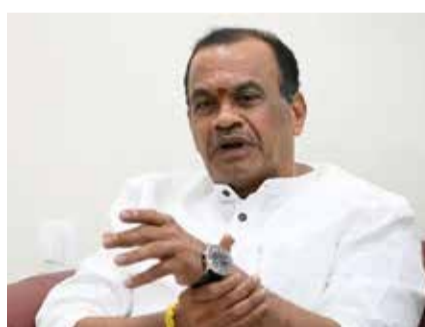
హైదరాబాద్, సిటీ టైమ్స్

తెలంగాణ రాజకీయాలు హాట్ హాట్ గా సాగుతున్నాయి. ఇటీవల అసెంబ్లీ సమావేశాల్లో అధికార కాంగ్రెస్, ప్రతిపక్ష టీఆర్ఎస్ సభ్యుల మధ్య మాటల యుద్ధం తారాస్థాయికి చేరుకుంది.