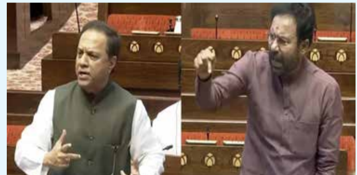
న్యూఢిల్లీ, సిటీ టైమ్స్

కాలేశ్వరం అంశంపై రాజ్యసభలో టీఆర్ఎస్ మంత్రి సురేష్ రెడ్డి అభ్యంతరం వ్యక్తం చేశారు. ఎంపీ సురేష్ రెడ్డి, కేంద్ర మంత్రి కిషన్ రెడ్డిల మధ్య వాగ్వాదం చోట చేసుకుంది. కేంద్ర