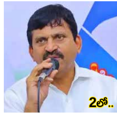
హైదరాబాద్, సిటీ టైమ్స్