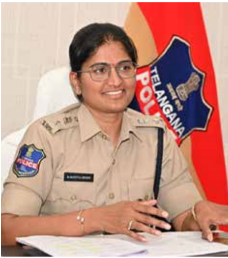
వనపర్తి జిల్లా పరిధిలోని వనపర్తి, కొత్తకోట, ఆత్మకూ వెలుపల 163 BNS (144 సెక్షన్) అమలులో

ఊటంబంది, లెక్కింపు కేంద్రాల పరిసరాల్లో భద్రత కోసం ప్రత్యేక బందోబస్త్, క్యూఆర్.టి.టీ.లను, డాగ్ స్కామ్, టీమ్స్, బాంబు డిస్పోజల్ టీమ్స్, స్పెకింగ్ పోర్టులు సిద్ధంగా ఉంచామని, ఎన్నికల ఫలితాలనే పట్టించుకోకుండా ప్రజలకు, అభ్యర్థులకు, గెలిచిన వారిని ఉద్దేశించి ముఖ్య సూచనలు జారీ చేశారు. ఎన్నికల ప్రవర్తన నియమావళి తప్పనిసరిగా పాటించాలి. ఫలితాల అనంతరం విజయోత్సవ ర్యాలీలు, జైక్ ర్యాలీలు, డీజేలు, టపాకాయలు కాల్యాటం, ఊరేగింపులకు అనుమతి లేదు. శాంతి భద్రతలకు భంగం కలిగించే చర్యలు ఛార్జిగా నిషేధం. జిల్లా పోలీస్ శాఖ ప్రత్యేక నిఘా ఏర్పాటు చేసినందున, గౌడవలు అల్లర్లు సృష్టించే వారిని, నిబంధనలకు విరుద్ధంగా విజయోత్సవ ర్యాలీలు నిర్వహించే వారిపై నిఘాలో తీసుకోవాలని ఉంటుంది తెలిపారు. ర్యాలీలు లేదా ఊరేగింపులు నిర్వహించుట కొరకు సంబంధిత అధికారుల ఉత్తర్వుల మేరకు వారు నిర్దేశించిన తేదీల్లో మాత్రమే జరుపుకోవాలి. ఎవరైనా నియమావళిని ఉల్లంఘిస్తే, లేదా శాంతి భద్రతలకు విఘాతం కలిగించేలా ప్రవర్తన, వారిపై కఠినమైన చట్టపరమైన చర్యలు తీసుకుంటామని హెచ్చరించారు. ప్రజలు చట్టాన్ని గౌరవించి, శాంతి భద్రతల పరిరక్షణకు సహకరించాలని, అలాగే, ప్రజలందరూ శాంతి, సామర్య వాతావరణాన్ని కాపాడాలని, ఫలితాలను పరస్పర గౌరవంతో స్వీకరించాలని ఎస్సీ విజ్ఞప్తి చేశారు.