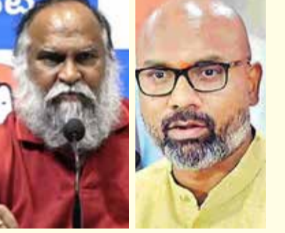
హైదరాబాద్, సిటీ టైమ్స్ నిజామాబాద్ పార్లమెంట్ సభ్యుడు ధర్మపురి అరవింద్ పై పోలీసులు కేసు నమోదు చేశారు. హరిచరణ్ మాస్టర్ పాఠశాలలో ఏర్పాటు చేసిన పోలింగ్ కేంద్రంలో జరిగిన ఘటనను ఎలక్షన్ కమిషన్ సీరియస్ గా తీసుకుంది.