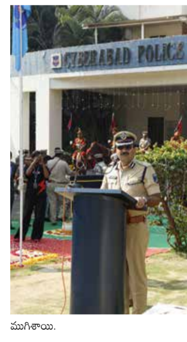
పోలీసింగ్ కొనసాగుతుందనే నందేశంతో వేడుకలు ముగిశాయి.