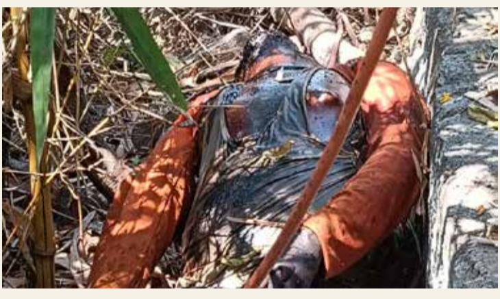
దుర్గం చెరువు వద్ద నిర్మాణవ్యవస్థ ప్రాంతంలో కుక్కన స్థితిలో శవం శేరిలింగంపల్లి, ఫిబ్రవరి 12 (సిటీ టైమ్స్):

మాదాపూర్ పోలీస్ స్టేషన్ పరిధిలోని దుర్గం చెరువు సమీపంలో గుర్తు తెలియని యువకుడి మృతదేహం లభ్యమైన ఘటన కలకలం రేపింది. పోలీసులు తెలిపిన వివరాల ప్రకారం... గురువారం బలాభ్యే సమీపంలోని రోడ్డు పక్కన ఒక పక్క పడి ఉన్నాడని సమాచారం అందడంతో పోలీసులు ఘటనాస్థలికి చేరుకుని పరిశీలించగా, నిర్మాణవ్యవస్థ ప్రాంతంలో కుక్కన స్థితిలో ఉన్న మృతదేహాన్ని గుర్తించారు. మృతుని వయస్సు సుమారు 25 నుంచి 30 సంవత్సరాల మధ్య ఉంటుందని పోలీసులు తెలిపారు. పింక్ రంగు టీషర్ట్, నల్ల రంగు జీన్స్ ప్యాంటు, నీల రంగు లోతుస్సులు ధరించి ఉండగా, తల వెంట్రుకలు కట్టిగా ఉన్నట్లు గుర్తించారు. శవం కుళ్ళిపోయిన స్థితిలో ఉండడంతో ముఖం స్పష్టంగా గుర్తుపట్టలేని పరిస్థితి నెలకొంది. చేతులు, కాళ్ళ వేళ్ళ చర్మం కూడా కుళ్ళినట్లు పోలీసులు వెల్లడించారు. మృతుని వివరాలు తెలిసిన వారు మాదాపూర్ పోలీస్ స్టేషన్ కు లేదా సంబంధిత అధికారుల మొబైల్ నంబర్ కు సమాచారం అందించాలని పోలీసులు విజ్ఞప్తి చేశారు. కేసు నమోదు చేసి దర్యాప్తు కొనసాగిస్తున్నట్లు తెలిపారు.