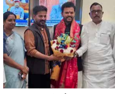
న్యూఢిల్లీ, సిటీ టైమ్స్ తెలంగాణ ముఖ్యమంత్రి రేవంత్ రెడ్డి.. ఢిల్లీ పర్యటన విజీ బిజీగా సాగుతోంది. ఈ క్రమంలోనే పలువురు కేంద్రమంత్రులతో సీఎం రేవంత్ రెడ్డి సమావేశమై చర్చిస్తున్నారు.