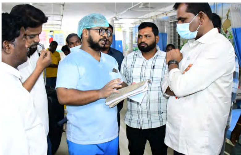
వనపర్తి కైమ్ సిటీ టైమ్స్ జనవరి 30