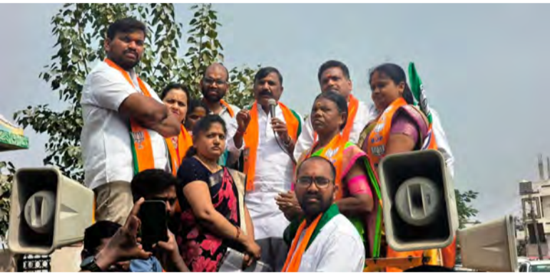
పటాన్చెరు, జనవరి 30 (సిటీ టైమ్స్):