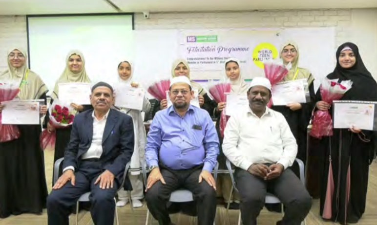
హైదరాబాద్, జనవరి 30 (సిటీ టైమ్స్):