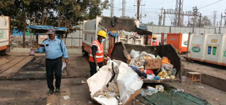
హైదరాబాద్, జనవరి 30, (సిటీ టైమ్స్):

జిహెచ్ఎంసీ ప్రత్యేక మెగా సానిటేషన్ డ్రైవ్ ముమ్మరంగా కొనసాగుతోంది. ఇప్పటి వరకు జిహెచ్ఎంసీ పరిధి 300 వార్డులలోని మొత్తం 6255 ఏరియాలు, ఫ్యాబ్రిక్ టన్నులు, ప్లాస్టిక్ టన్నులు, గార్బేజ్ వల్లరబుల్ ప్యాంట్ లు, పార్కర్ లలో ప్రత్యేక పారిశుధ్య కార్యక్రమం చేపట్టగా, ఇప్పటి వరకు అదనంగా 7372 మెట్రిక్ టన్నుల వ్యర్థాలు, 2468 నిర్మాణ వ్యర్థాలు మొత్తం 9840 మెట్రిక్ టన్నుల అదనపు వ్యర్థాల తరలింపు చేపట్టారు.