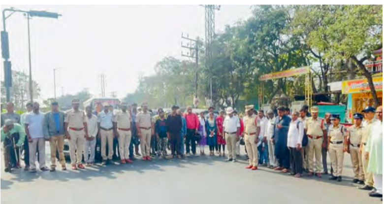
సైబరాబాద్, జనవరి 30 (సిటీ టైమ్స్):

మహాత్మా గాంధీ వర్ధంతి రోజున సైబరాబాద్ నగరం అరుదైన దృశ్యానికి సాక్ష్యంగా నిలిచింది. శాంతి, ఆహారం, సహనం అనే గాంధీజీ విలువలకు గౌరవ సూచకంగా నగరవ్యాప్తంగా రెండు నిమిషాల మౌనం పాటించారు. ఉదయం ఖచ్చితంగా 11 గంటలకు సైరన్ మోగానే రోజూ హారన్ల శబ్దాలతో మార్గం రూప దారులు ఒక్కసారిగా నిశ్శబ్దంలోకి వెళ్లారు. ఎలాంటి బలవంతం లేకుండా వాహనదారులు వాహనాలను నిలిపి మౌనం పాటించగా, పాదచారులు కూడా క్రణకాలం ఆగి గాంధీజీకి నివాళి అర్పించారు. * ప్రధానం కూడళ్లలో నిశ్శబ్దం: సైబరాబాద్ కమిషనరేట్ పరిధిలోని సైబర్ టవర్స్, ఖాజుగూడ, ఐకియా రోడ్లు, గచ్చిబౌలి, బోటానికల్ జంక్షన్, నార్సింగ్ రోడ్లు, అల్వీన్, మియాపూర్, బాపంపల్లి, చందానగర్, బీహెచ్ఐఎల్, కూకట్ పల్లి వైజంక్షన్, జీఎన్టీయూ షాంలస్టా, సుధారం, గాజులరామారం వంటి ప్రధాన జంక్షన్ల వద్ద ట్రాఫిక్ పోలీసులు ముందుగా ఏర్పాట్లు చేసి వాహనాలను క్రమబద్ధంగా నిలిపారు. * ప్రజలే ముందుకు: హారన్ వేయకుండా వాహనాలు నిలబడడం, మౌనంగా నిలబడడం ప్రజల అంతరంగ స్పందనగా మారింది. * ప్రాంతాలవారీగా స్పందన: జీడిమెట్ల పోలీస్ స్టేషన్ పరిధిలోని షాహర్ నగర్ షాంలస్టాలో అండ్ ఆర్డర్ పోలీసులు మౌనం పాటించగా, స్థానికులు స్వచ్ఛందంగా భాగస్వాములయ్యారు. జగద్గిరిగట్ల పోలీస్ స్టేషన్ పరిధిలోని పిల్లపాల్వే రోడ్డుపై కూడా వాహనదారులు, నివాసకులు కలిసి రెండు నిమిషాల నిశ్శబ్దాన్ని పాటించారు. * సజావుగా ముగింపు: మౌనం అనంతరం ట్రాఫిక్ ను క్రమబద్ధంగా పునరుద్ధరించడంతో ఎక్కడా అవాకర్షం కలగలేదు. ఈ రెండు నిమిషాల నిశ్శబ్దం గాంధీజీ బోధించిన శాంతి మార్గం ఇప్పటికీ ప్రజల హృదయాల్లో జీవించేస్తోందని స్పష్టంగా చాటివచ్చింది.