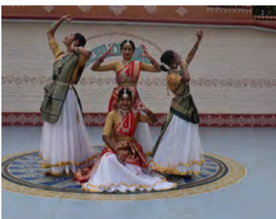
శేరిలింగంపల్లి, జనవరి 30 (సిటీ టైమ్స్):

శిల్పారామం-మాదాపూర్ లో చత్తీస్ గడ్ రాష్ట్ర కళాకారులు నిర్వహిస్తున్న గాంధీ శిల్ప బజార్ సందర్శకులతో కిటికీలాడుతుంది. సంప్రదాయ హస్తకళలు, కళాత్మక అభరణాలు, వస్త్రాల ప్రదర్శనకు నగరవాసుల నుంచి విశేష స్పందన లభిస్తోంది.