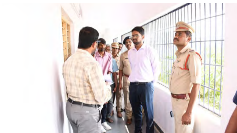
వనపర్తి బ్యూరో సిటీ టైమ్స్ జనవరి 30