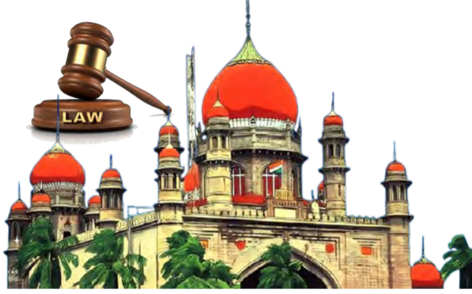
ల్యాండ్ పరిషోరం వివరాలను సమర్పించాలని ఈపీఎస్ హైదరాబాద్ రిజిస్ట్రార్ కమిషనర్, ఈఎన్ఐఐ డైరెక్టర్, రాష్ట్ర జైషద్ నియంత్రణ మండళ్లను సుమోచో ప్రతిపాదించారు.

గత ఏడాది సంగారెడ్డి జిల్లా పాఠశాలల్లోని సిగావి ఫార్మా కంపెనీలో పేలుడు సంభవించిన ఘటనలో 56 మంది దుర్మరణం పాలయ్యారు.