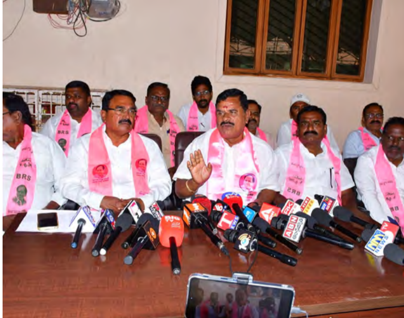
వనపర్తి బ్యూరో సీట్ టైమ్స్ జనవరి 29