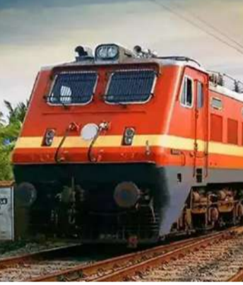
ఒరిజినల్ ఐడీ లేకపోతే ఏమి చేయాలి? మీ వద్ద ఒరిజినల్ ఐడీ పూర్వ లేకపోతే మీ ఈజిటీవెల్ చెల్లనిదిగా పరిగణించి బీటీఈ జరిమానా విధిస్తారు. మీకు కన్యూర్డ్ అయిన సీటును రద్దు చేయవచ్చు. విధించే జరిమానాలు ఏసీ తరగతి లక్షకే టిక్కెట్ ధరతో పాటు రూ. 440, అద్ వీలర్ క్లాస్ అయితే టిక్కెట్ ధరతో పాటు రూ. 220 ఉంటుంది. జరిమానా కట్టినా కూడా మళ్ళీ మీకు కేటాయించు ఉండదు.

దేశంలో అత్యధిక మంది ప్రయాణించే రవాణా సాధనం రైల్వేలు. రోజూ వేలాది రైళ్లు లక్షలాది మంది ప్రయాణికులను గమ్య స్థానాలకు చేరుస్తున్నాయి. కాగా కన్యూర్డ్ టిక్కెట్లతో ప్రయాణించే వారికి, ముఖ్యంగా ఆన్లైన్లో టిక్కెట్లు బుక్ చేసుకునే వారికి ఇండియన్ థాటర్మియల్ రైల్వే కొత్త ఆదేశాన్ని జారీ చేసింది. ఒరిజినల్ ఐడీ పూర్వ తప్పనిసరిగా తీసుకెళ్లాలి. ఒరిజినల్ ఐడీ లేకుండా రైలెక్కితే టిక్కెట్ తనిఖీ చేసే బీటీఈ మిస్టర్ టిక్కెట్లు లేని ప్రయాణికుడిగా పరిగణించి జరిమానా విధించవచ్చు. మీ టిక్కెట్ ను రద్దు చేసి, రైలు నుండి మిమ్మల్ని దించేయవచ్చు. అంగీకరించే ఐడీ పూర్వాల ఇవే..